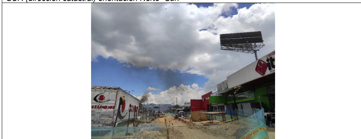
Foto No. 2 – Vista panorámica del panel orientación NORTE – SUR y de la estructura de la valla en buenas condiciones y estable.